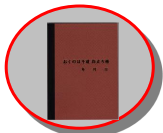
旅立ち記念ノート付き